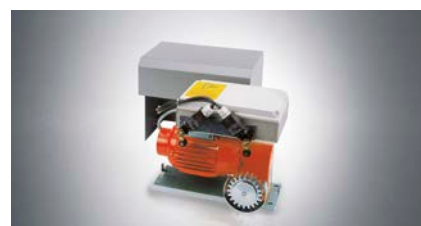
Schiebetorantrieb "DS 600/DS 1200"

Für Schiebetore bis 8 m Laufweg und 400 kg Torgewicht: Der komplette Antrieb des SP 900 ist im Pfosten des Schiebetors integriert. Das macht den Antrieb unsichtbar und sorgt für ein aufgeräumtes Bild am Schiebetor. Der SP 900 ist flexibel, robust und auch für Industrieanlagen geeignet.