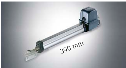
Drehtorantrieb "twist 200 E"

Für Drehtore bis 2,5 m Breite oder 300 kg Gewicht: Für Rechts- und Linksanschlag sowie in 1- und 2-flügeligem Betrieb, mit regeltem Softlauf in Rampenform ohne Kraftverlust sowie torschonendem und ruhigen Bewegungsablauf.