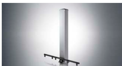
Schiebetorantrieb "SP 900"

Für Schiebetore bis 12 m Laufweg und 800 kg Torgewicht: RUNner+ wird noch besser den hohen Anforderungen von Industrieanlagen gerecht. Wie der RUNner ist er robust gebaut, widerstandsfähig, korrosionsbeständig, sicher, zuverlässig und hat einen leisen Torlauf.