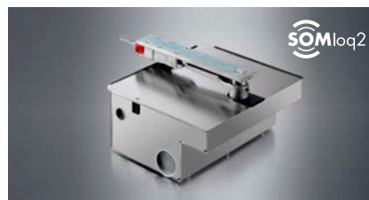
Drehtorantrieb "twist UG"

Für Drehtore bis 7 m Breite oder 1100 kg Gewicht: Universell einsetzbar für Rechts- und Linksanschlag sowie in 1- und 2-flügeligem Betrieb. Mit regeltem Softlauf in Rampenform ohne Kraftverlust sowie torschonendem und ruhigem Bewegungsablauf durch federnd gelagerte Gewindespindel.