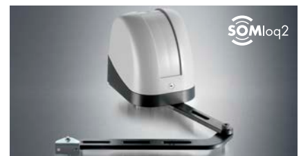
Drehtorantrieb "twist AM"

Für Drehtore bis 3,5 m Breite oder 350 kg Gewicht: Ideal für Drehtore, bei denen der Antrieb nicht sichtbar sein soll. Universell einsetzbar für Rechts- und Linksanschlag sowie in 1- und 2-flügeligem Betrieb. Mit modernem, bidirektionalen und sicheren Funksystem SOMloq2.