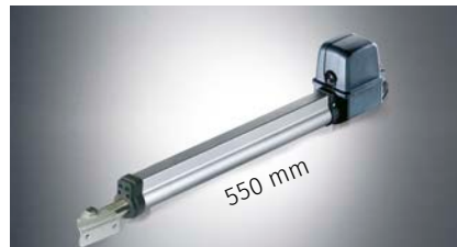
Drehtorantrieb "twist 200 EL"

Für Drehtore bis 2,5 m Breite oder 300 kg Gewicht: Für Rechts- und Linksanschlag sowie in 1- und 2-flügeligem Betrieb, mit regeltem Softlauf in Rampenform ohne Kraftverlust sowie torschonendem und ruhigen Bewegungsablauf.