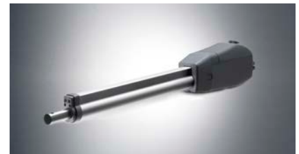
Drehtorantrieb "twist 350"

Für Drehtore bis 2,5 m Breite oder 300 kg Gewicht: Mit noch mehr Hub wird dieser Antrieb zum Alleskönner: der längere Bewegungshub sorgt für höchste Kraft auch bei steil verbautem Antrieb oder sehr breiten Pfosten.