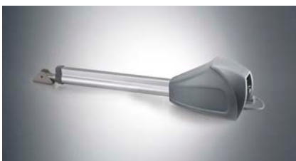
Drehtorantrieb "twist XL"

Für Drehtore bis 4 m Breite oder 700 kg Gewicht: Wie auch der twist 200 E und twist 200 EL ist auch der twist 350 universell einsetzbar: Für Rechts- und Linksanschlag sowie in 1- und 2-flügeligem Betrieb. Und das in elegantem Design.